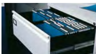
Låda med A4 mappar