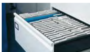
Låda med folio mappar